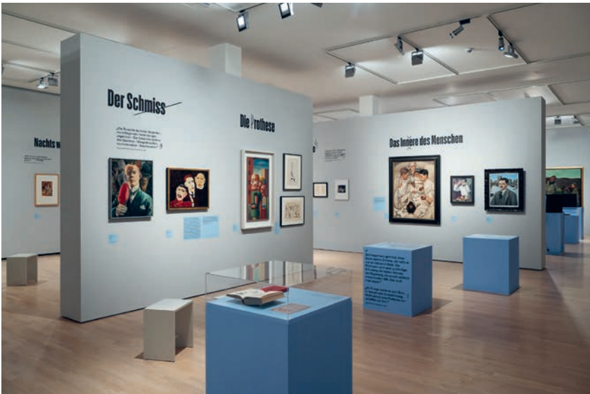
Ausstellungsansicht/Installation Shot, Ein Ferngespräch. Szenen aus der Weimarer Republik/A Long-Distance Call: Scenes from the Weimar Republic/Städtische Galerie im Lenbachhaus und Kunstbau München/Lenbachhaus Munich, 2026.