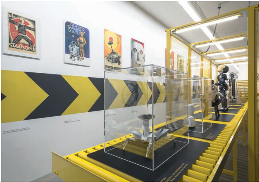
Ausstellungsansicht „Robotic Worlds“, Die Neue Sammlung