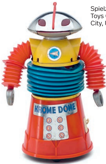
Spielzeug-Roboter "Krome Dome", 1970er Jahre, Yonezawa Toys Co. Ltd., Tokio, Japan für Megp Corporation, New York City, USA.

fähige Automaten. Haushaltshelfer und echte Spielzeugroboter wurde in den späten 1990er- und frühen 2000er-Jahren meist in Tierform ausgeführt. In jüngerer Zeit sind einige Service-Roboter auch neutral gehalten. Die humanoiden Roboter werden hingegen dem Menschen immer ähnlicher. Sie sollen theoretisch auch menschliche Aufgaben übernehmen können – von der Konversation über das Erledigen von Haushaltsarbeiten bis hin zu Aufgaben von automatisierten Pfleger*innen und Ärzt*innen.