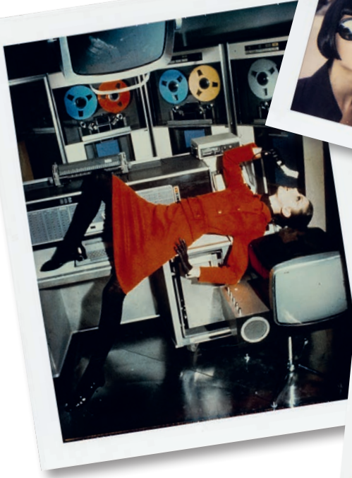
French Vogue, Paris 1965, Italian Vogue, Monte Carlo 2003, Cindy Crawford, American Vogue, Monte Carlo 1991