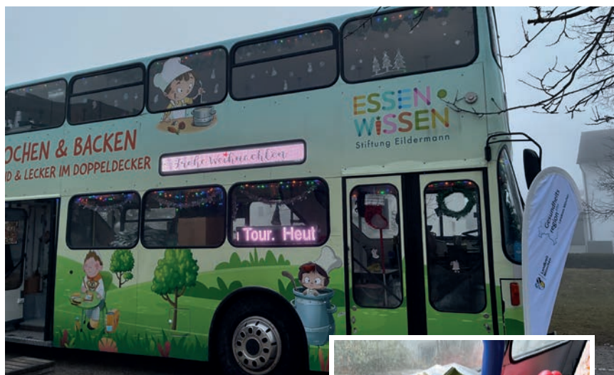
Im „Backbus“ lernen Schulkinder, wie einfach ein gesundes Frühstück sein kann.

Wir nutzen regionale Daten und Besonderheiten, um die Strukturen und Prozesse vor Ort zu verbessern und die Gesundheitsplanung aktiv zu gestalten. Bei unserer jährlichen Gesundheitskonferenz kommen die Vertreterinnen und Vertreter verschiedener Institutionen, wie z.B. aus Krankenkassen, Wohlfahrtsverbänden sowie stationären und ambulanten Einrichtungen zusammen. Die Gesundheitskonferenz ist ein Kernelement unserer Arbeit. In Arbeits- und Projektgruppen beschäftigen wir uns zudem mit aktuellen oder langfristigen Themen.