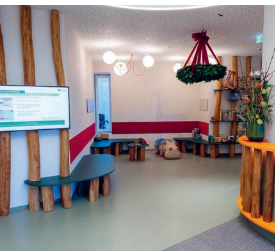
iSPZ Hauner MUC