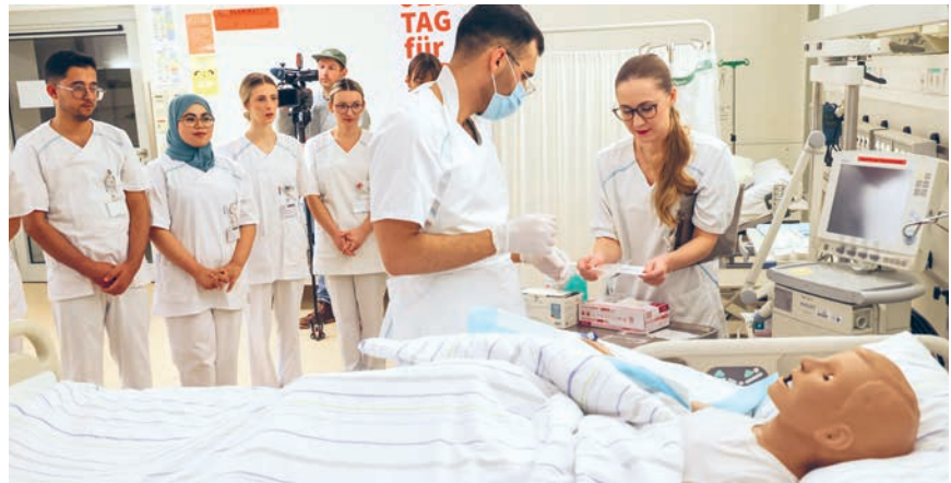
Angeleitet durch eine Praxisanleiterin versorgen Pflegekräfte die Puppe Luca nach einer Blinddarm-OP

Der Münchner Stadtrat hat 2023 den Aufbau eines Kompetenzzentrums für internationale Pflegekräfte (KiP) für München beschlossen. Beauftragt mit dem Aufbau und dem Betrieb wurde nach Ausschreibung die München Klinik (MüK). Bis zu 500 internationale Pflegekräfte sollen im Zentrum auf dem Gelände der München Klinik Schwabing pro Jahr künftig das Anerkennungsverfahren durchlaufen können. Das Projekt wird mit rund 3 Millionen Euro von der Landeshauptstadt München (LHM) gefördert und ergänzt das bestehende Angebot der Münchner Pflegeschulen. Es trägt dem Fachkräftemangel im Pflegebereich Rechnung und soll die Wartezeiten für die dringend benötigte Pflegeverstärkung verkürzen und deren Integration in den Münchner Arbeitsmarkt beschleunigen. Im September nahm das Kompetenzzentrum seine Arbeit auf, und aktuell werden auf dem