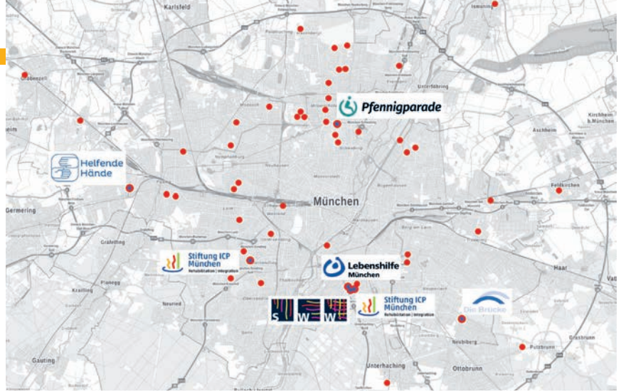
Karte: Geobasisdaten: Bayerische Vermessungsverwaltung – www.geodaten.bayern.de ; Fachdaten der Träger der Einrichtungen bearbeitet von H. Baumgartner (Pfennigparade).

Wir fürchten, dass wir in naher Zukunft noch mehr Schwierigkeiten