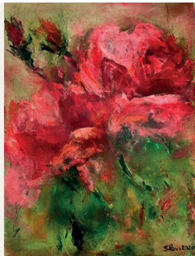
oben: „Rock YOU II“, unten: „Wilder Rosengarten“