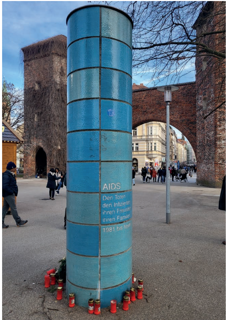
Das Kunstwerk von Wolfgang Tillmans am Sendlinger-Tor-Platz erinnert an die vielen Toten und das Leiden durch die HIV-Pandemie.

Spätestens die Covid-Pandemie hat gezeigt: Vor weiteren Pandemien sind wir nicht gefeit. Heute ist evident, dass der Mensch wesentlich für das Auftreten von Pandemien